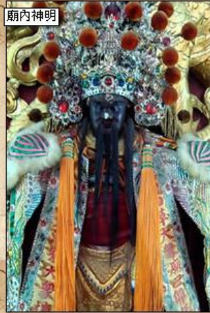
鎮殿鎮海大元帥(前殿)